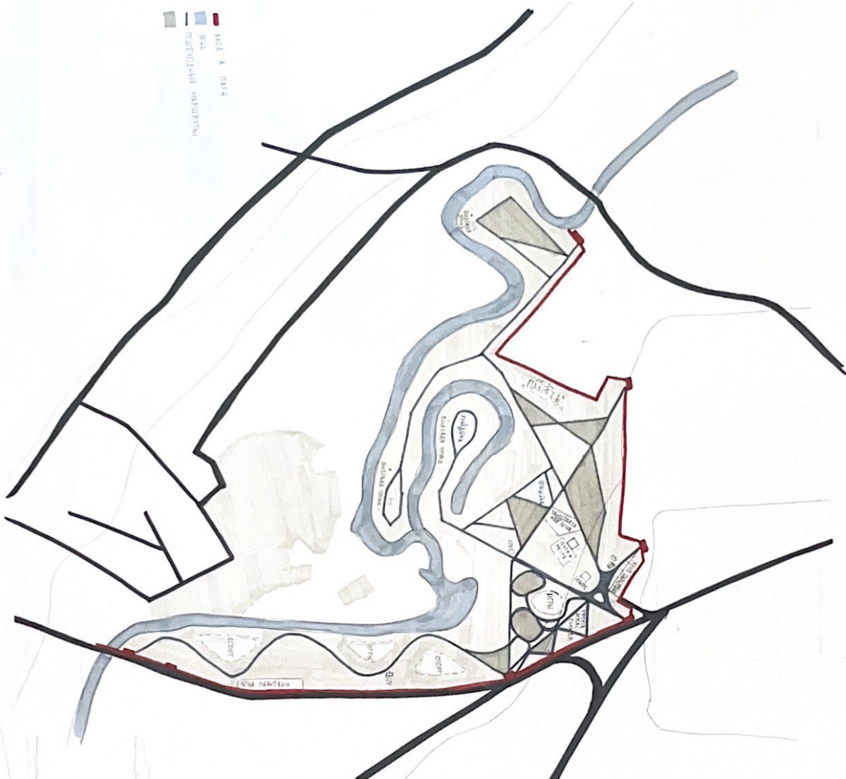
СХЕМА ФУНКЦИОНАЛЬНОГО ЗОНИРОВАНИЯ

— КОЛЛЕКТОР — ВОД. — МЕТЕОРИТАЛЬНАЯ КАМЕНЬЯ