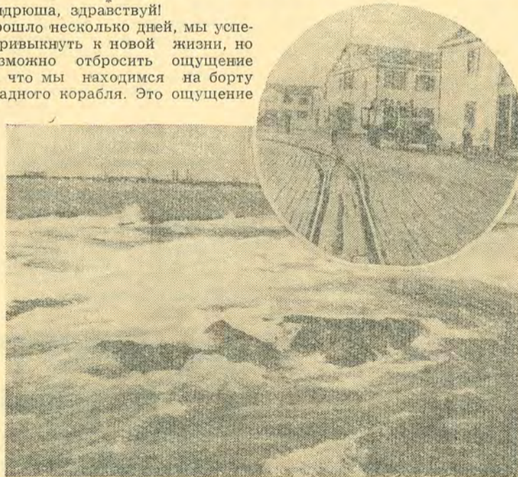
На снимках, сделанных студентом факультета ГС Е. Молозевым, вы видите море близ «Нефтяных камней» и одну из улиц «Каспийской Венеции».