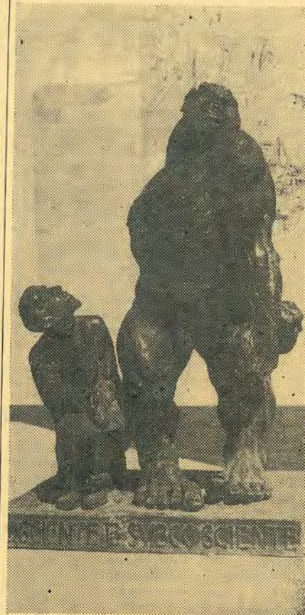
Рим. Образец современной итальянской скульптуры.